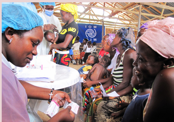
Una enfermera de la OIM atiende a pacientes y proporciona medicación en la unidad de salud móvil en Liberia.

En 2017, la OIM implementó 85 proyectos prestando servicios a poblaciones afectadas de 32 países; 47% en África, 26% en Oriente Medio y África del Norte, 19% en Asia, 5% en Europa y 3% en Américas.