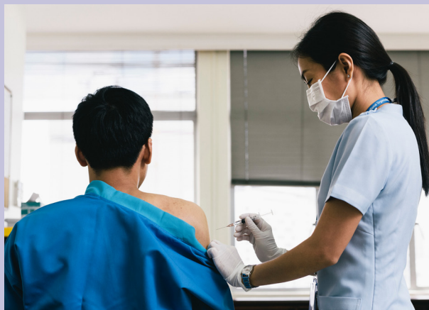
El Centro de evaluación de la salud migratoria de la OIM en Tailandia proporciona servicios de salud para las personas migrantes que están a punto de viajar.

En 2017, la OIM llevó a cabo alrededor de 347.000 evaluaciones de salud para migrantes en más de 60 países; éstas cubrieron tanto a inmigrantes (70.7%) como a refugiados (29.3%).