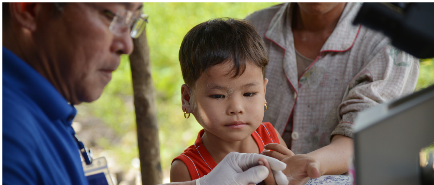
En una unidad de salud móvil de la OIM se realizan pruebas de diagnóstico rápido para el paludismo en Myanmar.