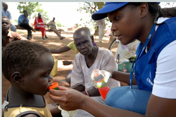
Un miembro del equipo médico de la OIM ofrece un tratamiento de rehidratación oral a un niño durante su viaje de retorno a Mundri (Sudán del Sur).

En 2019, la OIM sigue implementando sus actividades en el mundo entero, desarrollando estrategias de colaboración con relevantes sectores tales como la salud, el bienestar, el trabajo, la juventud, los asuntos sociales y la migración para reforzar los sistemas de la salud adaptados a las personas migrantes.